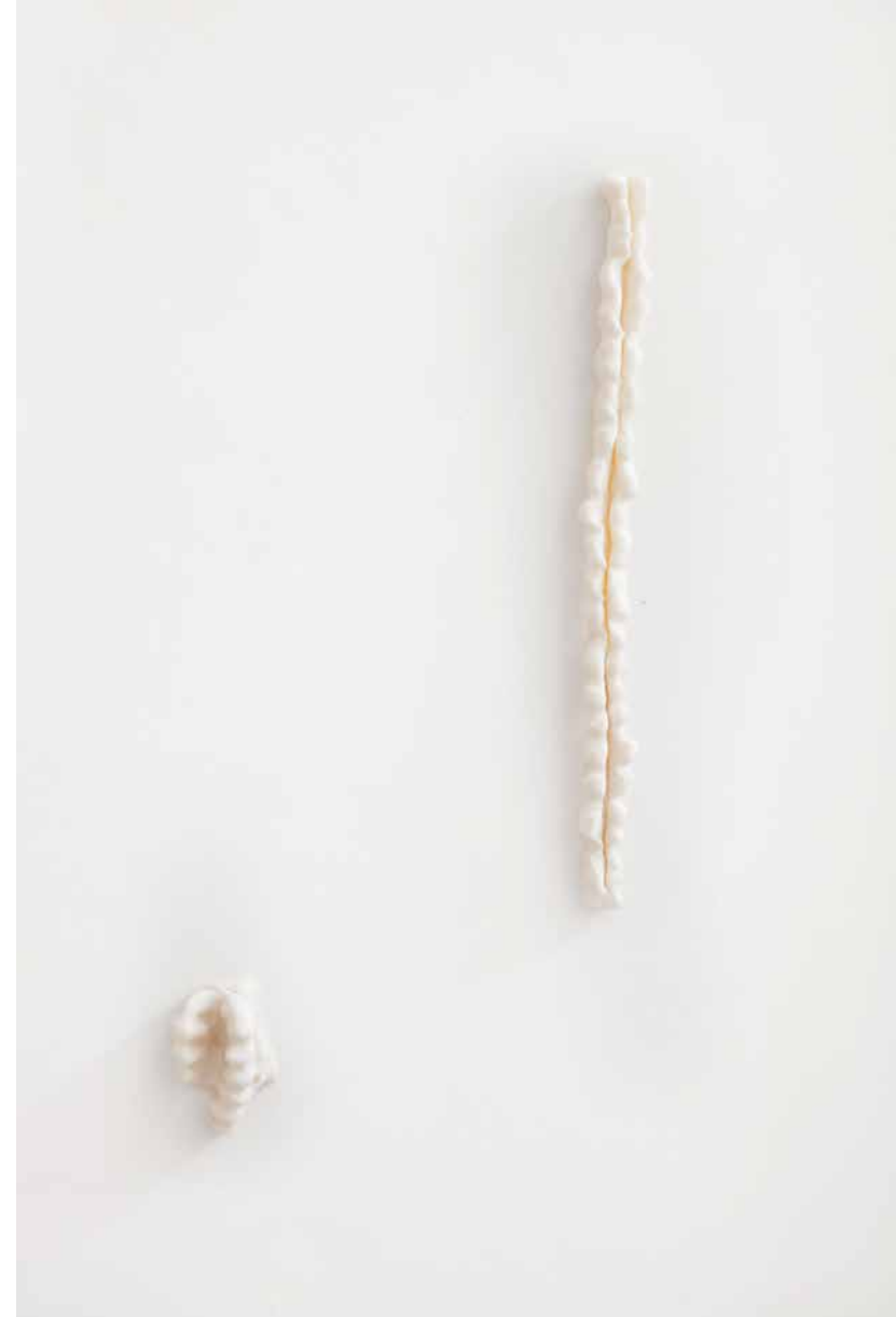
Título / Title: Sin Titulo de Donde habita lo Oculto Untitled from Where the hidden exist Técnica / Technique: Instalación sobre pared, porcelana fría Installation on wall, cold porcelain Dimensiones / Dimensions: 50 x 70 cm Año / Year: 2015