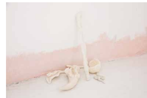
Título / Title: Sin Titulo de Donde habita lo Oculto Untitled from Where the hidden exist Técnica / Technique: Instalación, escultura, ceramica, acrilico y arcilla seca Installation, sculpture, ceramic, acrylic paint and dry clay Dimensiones / Dimensions: 132 x 33 x 66 cm Año / Year: 2015