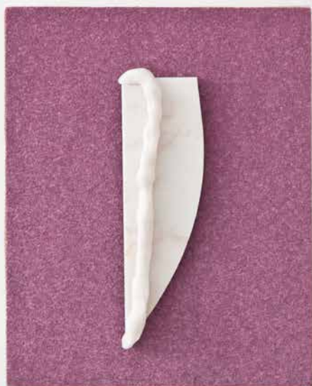
Título / Title: Sin Titulo de Donde habita lo Oculto Untitled from Where the hidden exist Técnica / Technique: Lija, madera, ceramico y porcelana fria Sandpaper, wood, ceramic and cold porcelain Dimensiones / Dimensions: 21 x 26 cm Año / Year: 2015