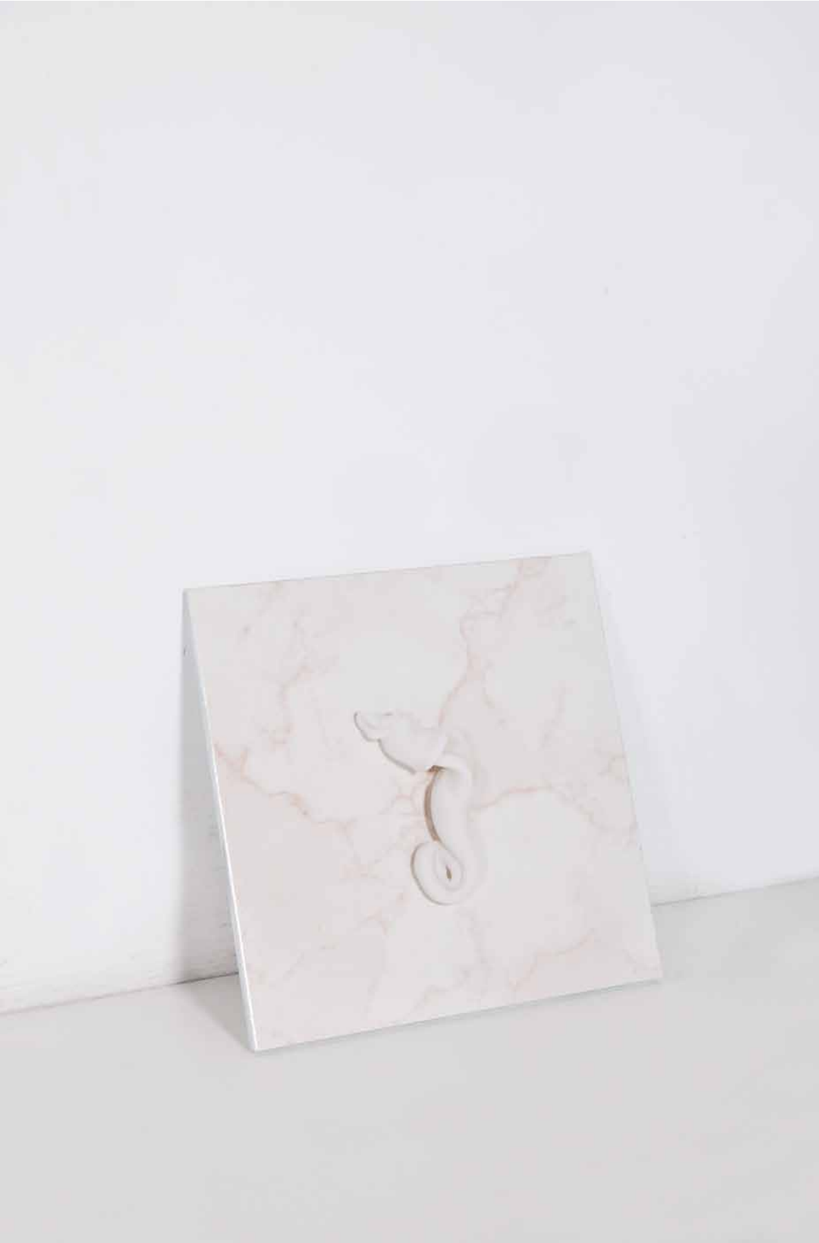
Imagen Previa - Previous Image

Título / Title: Sin Título de Sistema Universal Untitled from Universal System