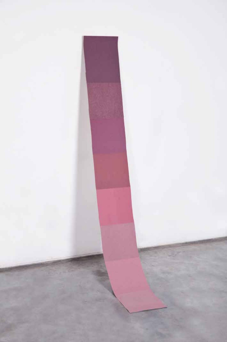
Título / Title: Sin Titulo de Sistema Universal Untitled from Universal System Técnica / Technique: 8 Lijas superpuestas 8 superimposed Sandpapers Dimensiones / Dimensions: 21 x 180 cm Año / Year: 2016